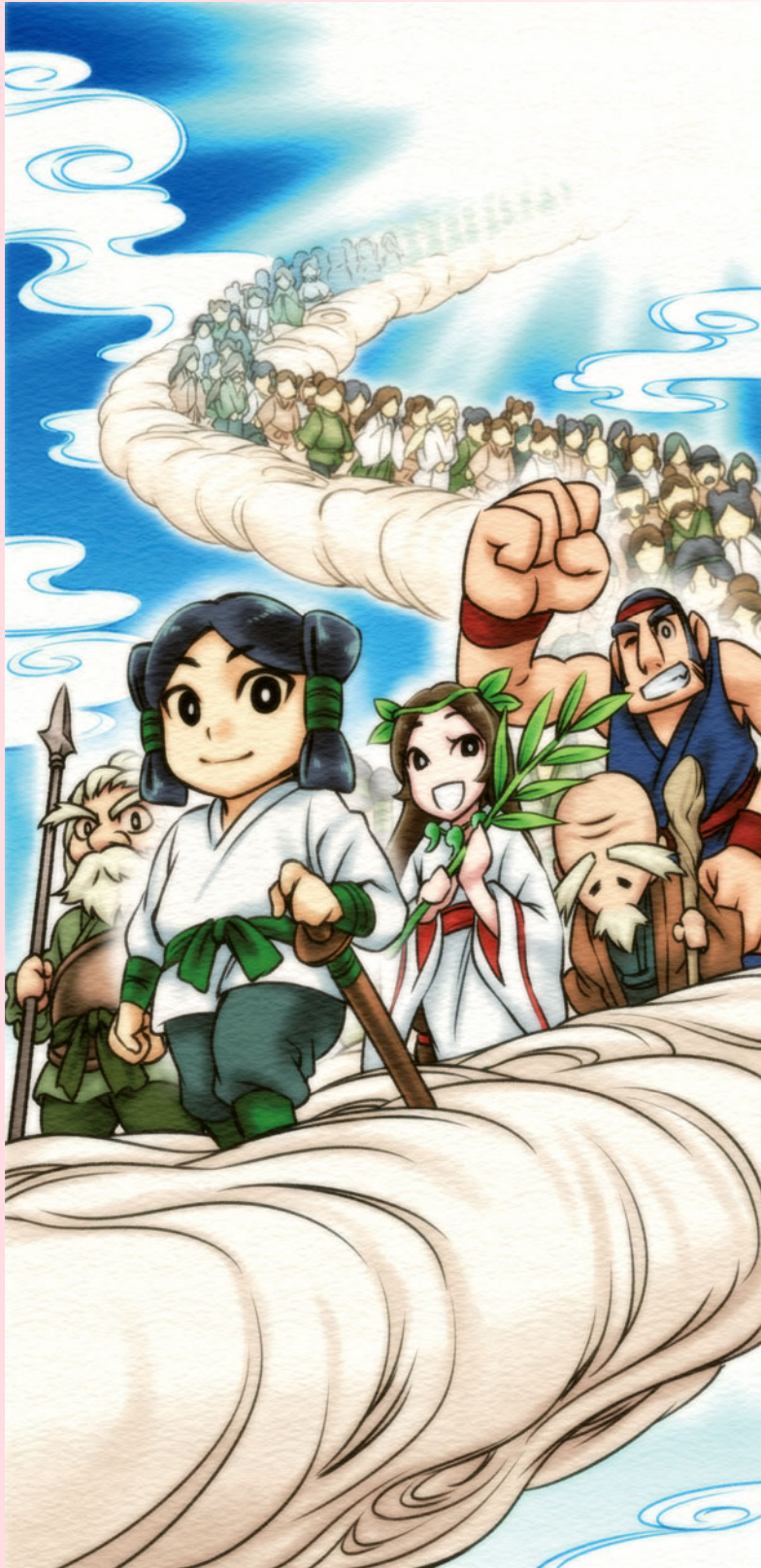
◎ おとうさん、おかあさん、おじいちゃん、おばあちゃんへ！ 古来より伝わる神話を、お子さまやお孫さまと一緒に読んでいただき 子供たちの情操教育の一助となりましたら幸いです。

葦原の中ノ国へ向けて旅立ちました。その行列はあまりにも 神々しく、あまりにも立派な様子なので、葦原の中ノ国の神 様たちも見とれるばかりでした。 瀬瀬吉の命たちが最初に辿り着いたのは、高千穂という場 所でした。(今の宮崎県と一口言い伝えがあまります) 高千穂