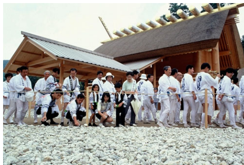
お白石持行事

前々回にあたる第六十回式年遷宮より、全国の崇敬者も「特別神領民」としてご奉仕する事が許されるようになり、また前回のお白石持ち行事には、旧神領民・特別神領民併せて凡そ二十一人の崇敬者が全国から集いました。来年のお白石持行事には、前回を上回る崇敬者が賑々しく集うと予想されております。当神社崇敬会と致しましては、来年七月中から八月末の間でのお白石持行事への参加を企画中でございます。