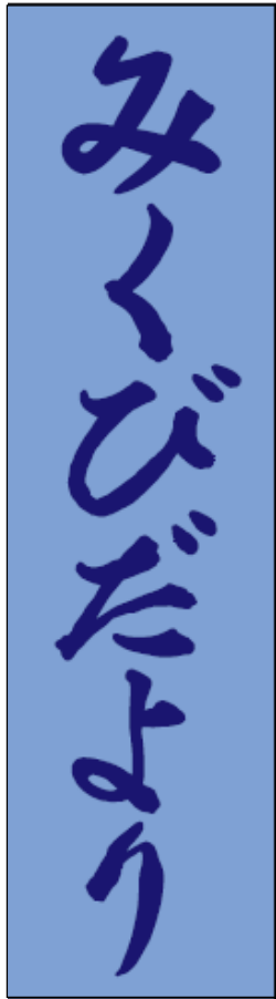
発行 御首神社社務所