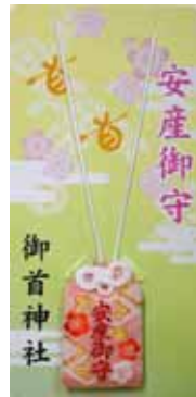
安産御守 初穂料七〇〇円