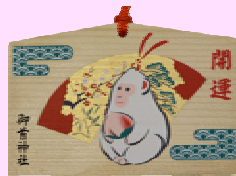
祈願絵馬 初穂料 500円