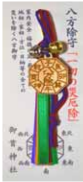
八方除御守 初穂料七〇〇円