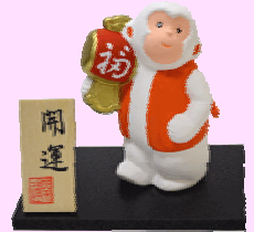
干支土鈴 初穂料 800円