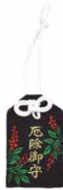
厄除御守 初穂料七〇〇円