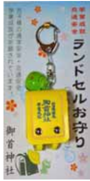
学業・交通安全御守(他四色有) 初穂料一,〇〇〇円