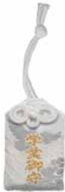
学業御守 初穂料五〇〇円