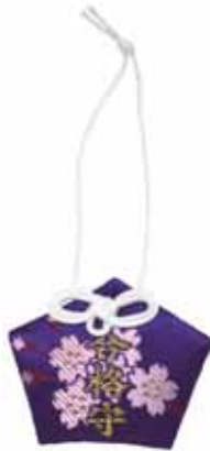
合格御守 初穂料八〇〇円