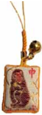
開運十二支御守(全十二支有) 初穂料七〇〇円