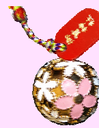
さくら鈴 初穂料 500円